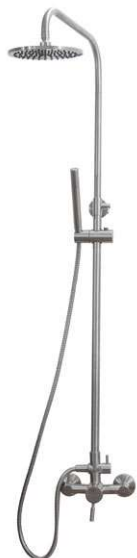
720405 Premium Quincaillerie de douche haut de gamme Hardware