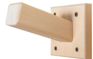
603022 Crochet à serviette simple (cèdre blanc)