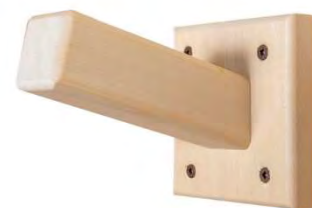
603022 Crochet à serviette simple (cèdre blanc)