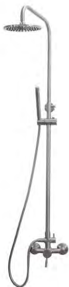
720405 Premium Quincaillerie de douche haut de gamme Hardware