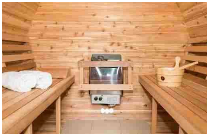
Entrée sous le chauffage électrique sur la paroi arrière

Pour les saunas équipés de poêles à bois, placez l'entrée le plus près possible du poêle à bois et la sortie en hauteur dans le coin opposé.