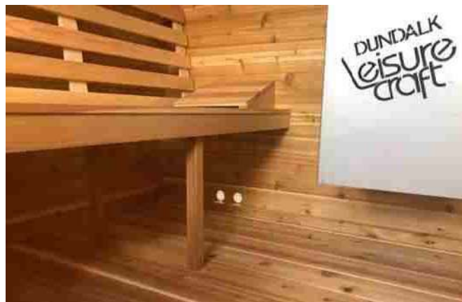
Entrée à côté du poêle à bois sur le mur arrière