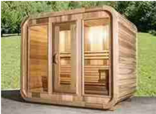
Bloc de béton

Il est recommandé d'installer une base solide pour votre sauna, qui peut être fabriquée à partir de l'un des éléments suivants.