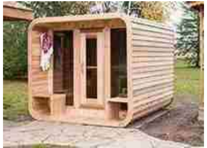
Pierres de patio/blocs de pavés

Il est recommandé de construire une base plus grande que nécessaire afin de disposer d'un espace pour s'asseoir et se rafraîchir pendant la séance de sauna.