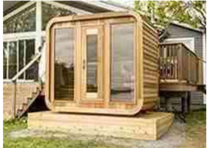
Pont en bois